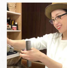
ママさんスタイリスト

OKURAは女性が働きやすい環境が整っており、産前産後休暇が充実しているため、ママスタイリストでもしっかり働けます。子供がいることを最優先に考えてくれる職場ですので、急な早退、欠勤も快く受け入れてくれるスタッフと毎日楽しく働いております。何よりお客様との楽しい会話、笑顔を見れる事がとても幸せです。子育てを中心に自分のペースで働けるOKURAと一緒に働きましょう!!