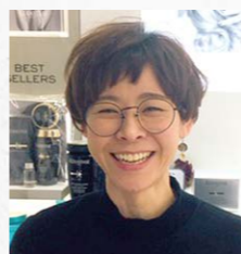
育休明けママさんスタイリスト

OKURAは、子育て中のスタッフそれぞれの生活に合わせた働き方を受け入れてくれる会社です。無理のない勤務時間を自分で選択できますので、気持ちにも余裕ができ、家族との時間も大切にできます。子供がいますので、もちろん急な勤務変更もありますが、理解ある同僚達にフォローしてもらいつつ、楽しく仕事に取り組んでいます。育児休暇を終え、復帰して1年。今では、仕事の子育て、子育てが仕事の心の支えになっている様に感じています。